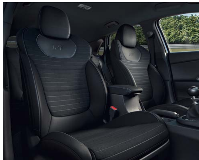
Tapicerka skórzana (elementy wykonane ze skóry ekologicznej i zamszu)