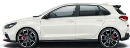
POLAR WHITE (PYW - BEZ DOPŁATY)