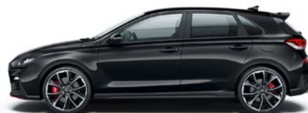
PHANTOM BLACK (PAE - PERŁOWY)