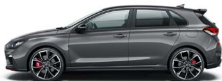
MICRON GREY (Z3G - METALICZNY)