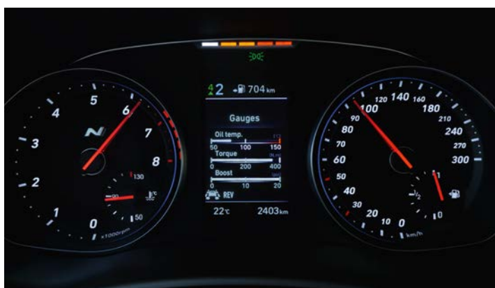
Sportowy zestaw wskaźników