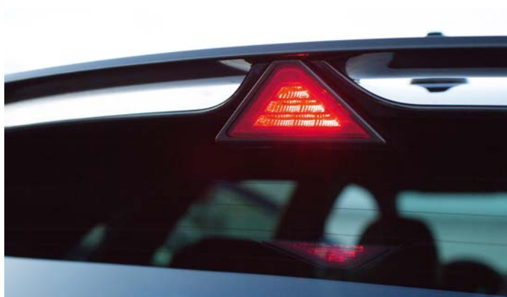
Tylne trójkątne światło STOP