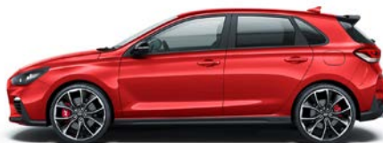
ENGINE RED (JHR - BEZ DOPŁATY)