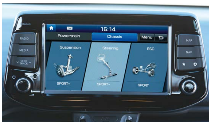
Nawigacja z trybem ustawień