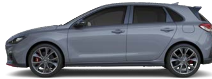
SHADOW GREY (TKG - SPECJALNY)