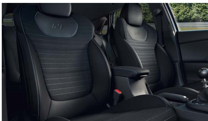
Tapicerka skórzana (elementy wykonane ze skóry ekologicznej i zamszu)