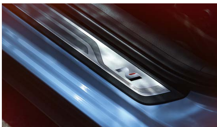
Nakładki progowe N