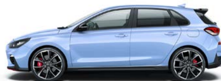
PERFORMANCE BLUE (XFB - SPECJALNY)