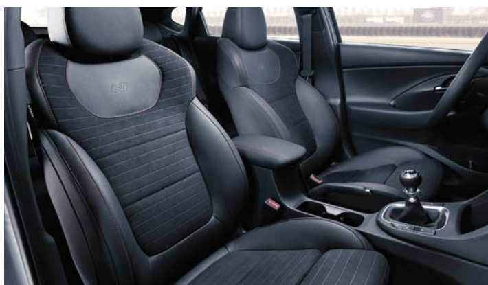
Tapicerka skórzana (elementy wykonane ze skóry ekologicznej i zamszu)