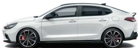
POLAR WHITE (PYW - BEZ DOPŁATY)