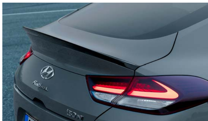
Spojler na klapie bagażnika