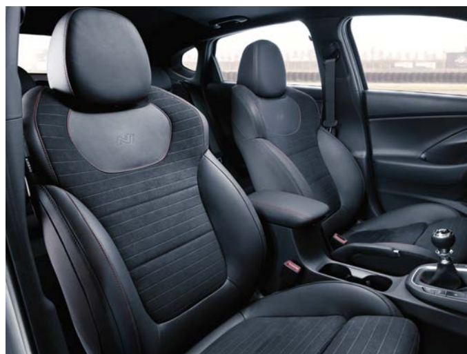
Tapicerka skórzana (elementy wykonane ze skóry ekologicznej i zamszu)