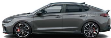
MICRON GREY (Z3G - METALICZNY)