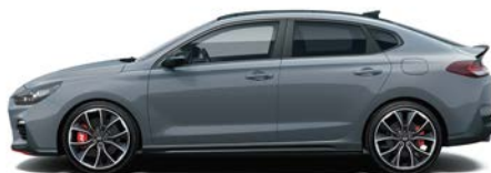
SHADOW GREY (TKG - SPECJALNY)