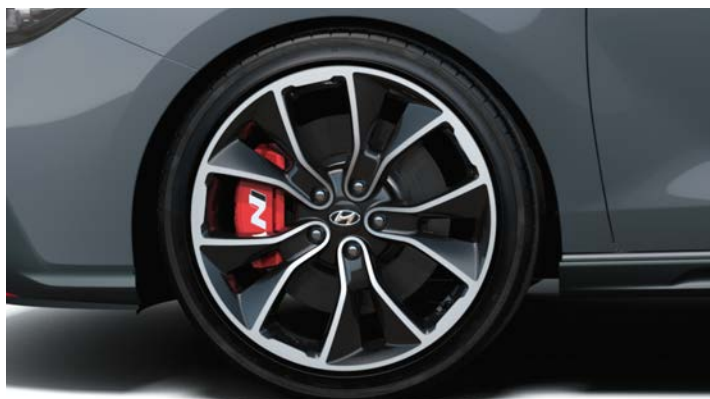
Felgi 19" z hamulcami N