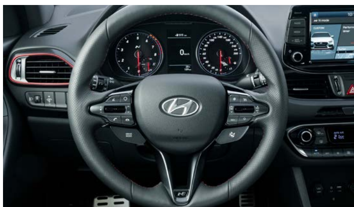
Sportowa kierownica pokryta perforowaną skórą