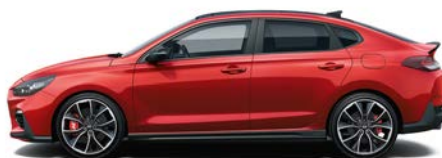
ENGINE RED (JHR - BEZ DOPŁATY)