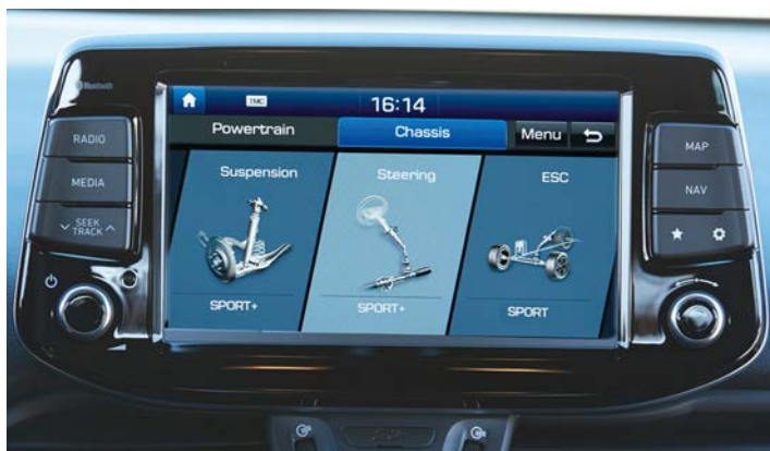
Nawigacja z trybem ustawień