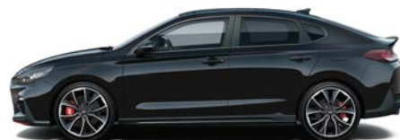
PHANTOM BLACK (PAE - PERŁOWY)