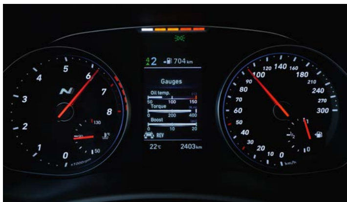
Sportowy zestaw wskaźników