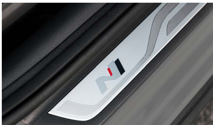
Nakładki progowe N