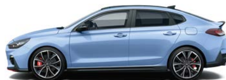
PERFORMANCE BLUE (XFB - SPECJALNY)