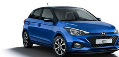
CZARNY DACH ORAZ LUSTERKA (nieдоступny dla kolorów Phantom Black, Cashmere Brown i Aqua Sparkling)