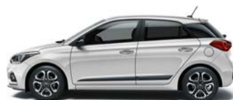
SLEEK SILVER (RYS - METALICZNY)