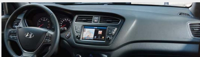
Tapicerka czarna (TRY)