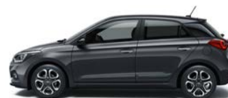
STAR DUST (V3G - METALICZNY)