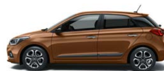
CASHEMERE BROWN (X9N - METALICZNY)