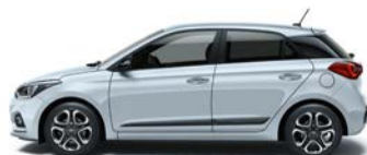
CLEAN SLATE (UB2 - METALICZNY)