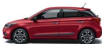
PASSION RED (X2R - PERŁOWY)