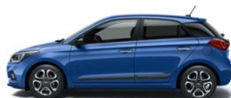
CHAMPION BLUE (U2U - METALICZNY)