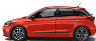
TOMATO RED (TTR - BEZ DOPŁATY)