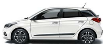
POLAR WHITE (PSW - BEZ DOPŁATY)