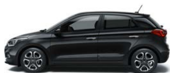
PHANTOM BLACK (X5B - PERŁOWY)