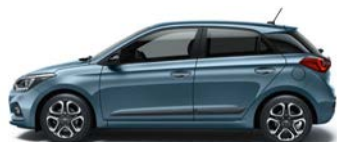
AQUA SPARKLING (W3U - METALICZNY)