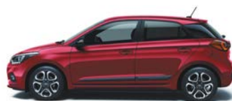
DRAGON RED (WR7 - PERŁOWY)