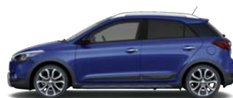
CHAMPION BLUE (U2U - METALICZNY)