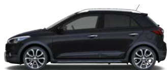
PHANTOM BLACK (X5B - PERŁOWY)