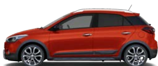
TOMATO RED (TTR - BEZ DOPEŁATY)