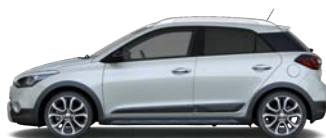
CLEAN SLATE (UB2 - METALICZNY)