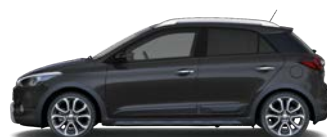
STAR DUST (V3G - METALICZNY)