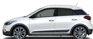
POLAR WHITE (PSW - BEZ DOPEŁATY)