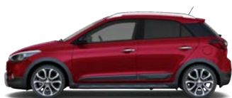
DRAGON RED (WR7 - PERŁOWY)