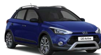
CZARNY DACH ORAZ LUSTERKA (nie dostępne dla kolorów Phantom Black)