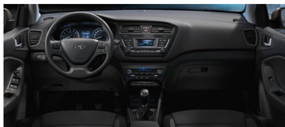
Szary (antracytowy) (TRY)