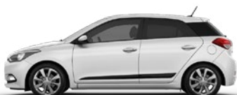
POLAR WHITE (PSW - BEZ DOPŁATY)