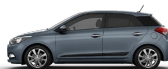
AQUA SPARKLING (W3U - METALIK)