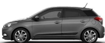
STAR DUST (V3G - METALIK)