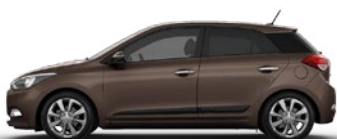
CASHEMERE BROWN (X9N - METALIK)