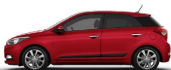
PASSION RED (X2R - PERŁOWY)