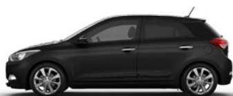
PHANTOM BLACK (X5B - PERŁOWY)