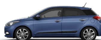
MORNING BLUE (X3U - BEZ DOPŁATY)