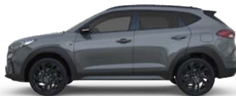
SHADOW GREY * (TKG - SPECJALNY)