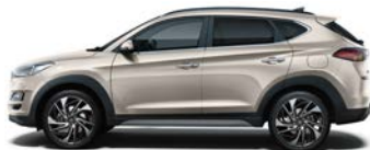
WHITE SAND * (Y3Y - METALICZNY)