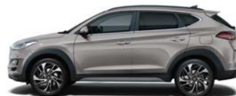
SILKY BRONZE (B6S - METALICZNY)