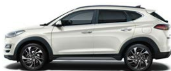
POLAR WHITE (PYW - BEZ DOPLĄTY)