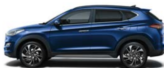
STELLAR BLUE (RWB - METALICZNY)