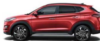
FIERY RED * (PR2 - METALICZNY)