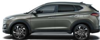
OLIVINE GREY (X5R - METALICZNY)