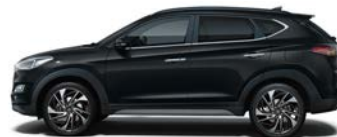
PHANTOM BLACK (PAE - PERŁOWY)