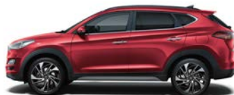
SUNSET RED (WR6 - PERŁOWY)