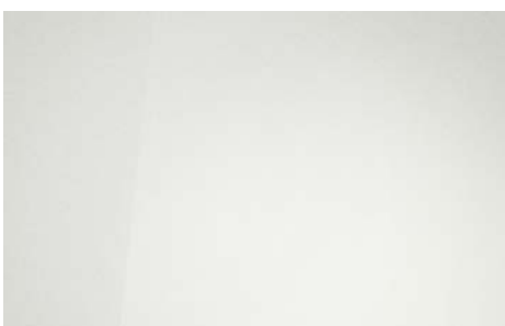
POLAR WHITE (PYW – SPECJALNY)