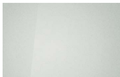
PLATINUM SILVER (U3S – METALICZNY)