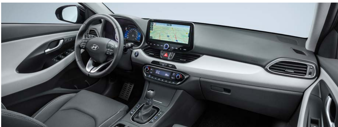
CZARNO-SZARE (Comfort, Premium)