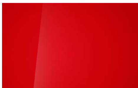
ENGINE RED (JHR – BEZ DOPŁATY)