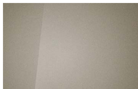
SILKY BRONZE (B6S – METALICZNY)