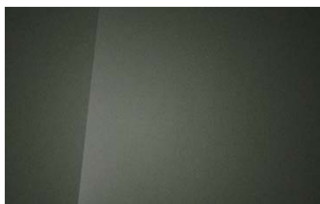
OLIVINE GREY (X5R – METALICZNY)