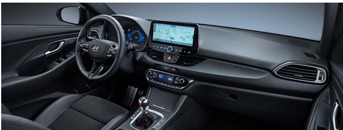
CZARNE (N Line)