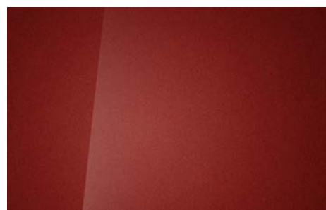
SUNSET RED (WR6 – PERŁOWY)