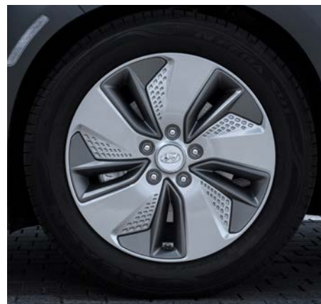
Felgi aluminiowe 17"