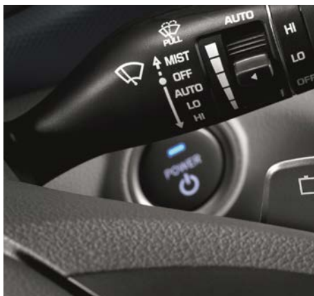
Bezkluczykowy dostęp i przycisk Start/Stop