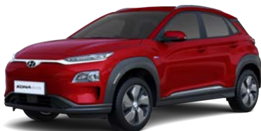
Pulse Red (Y2R – metaliczno-perłowy)