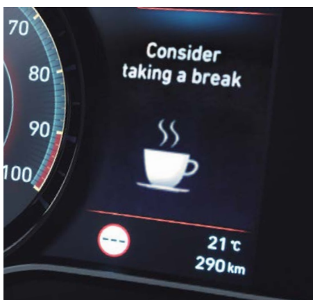
System monitorujący poziom koncentracji uwagi kierowcy (DAA)