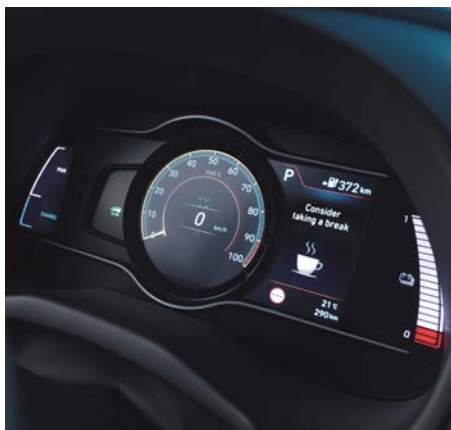
Cyfrowe zegary z 7" kolorowym ekranem