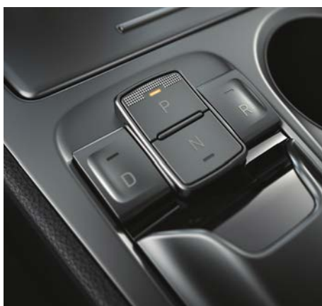
Selektor jazdy trybu Shift-by-wire