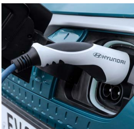
Ładowarka pokładowa 7,2 kW