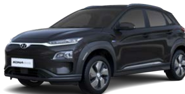
Dark Knight (YG7 – perłowy)