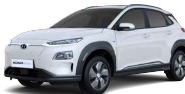
Chalk White (P6W – metaliczny)