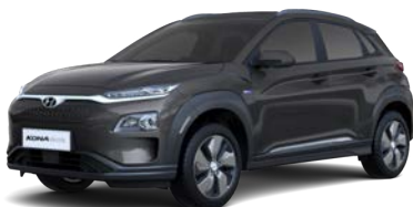
Galactic Grey (R3G – perłowy, bez dopłaty)