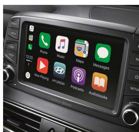
Radio z 7" kolorowym ekranem dotykowym