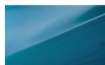
AQUA BLUE (METALIK)