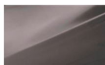
CASHMERE BROWN (PERŁOWY)