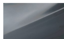
STEEL GRAY (METALIK)