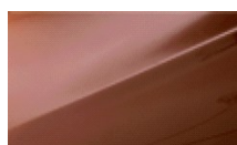
HAZEL BROWN (METALIK)