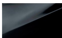
PHANTOM BLACK (PERŁOWY)