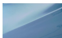
ICE BLUE (METALIK)