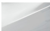
CREAMY WHITE (SOLID)