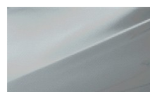
SLEEK SILVER (METALIK)