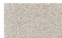
P3W MUSHROOMS (PERŁOWY)