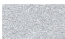
P3S SLEEK SILVER (METALIK)