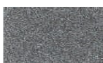
P5S HYPER SILVER (METALIK)