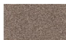
P7P BRONZE (METALIK)