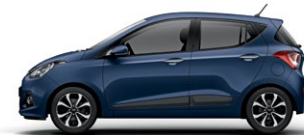
MORNING GLORY (X3U - BEZ DOPŁATY)

Dostępność kolorów nadwozia ograniczona. Nie można zamówić do produkcji.