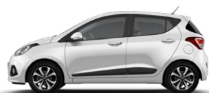
POLAR WHITE (PSW - BEZ DOPŁATY)